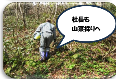
社長も 山菜採りへ

今年も4月下旬から「由利鉄の社長と社員が山で採ってきた山菜」を矢島駅とWEBショップで由利鉄特別価格で販売いたしました！売れ行きは大盛況で、特に「タケノコ」・「サンボ」・「タラの芽」が大人気でした。GWということもあり、地元の方だけではなく、観光や帰省の方等沢山の方々にお願いいただきました。ご購入いただいた皆様、ありがとうございます。来年も山菜を販売する予定なので、乞うご期待ください！！