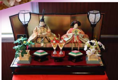
※写真は過去のものです