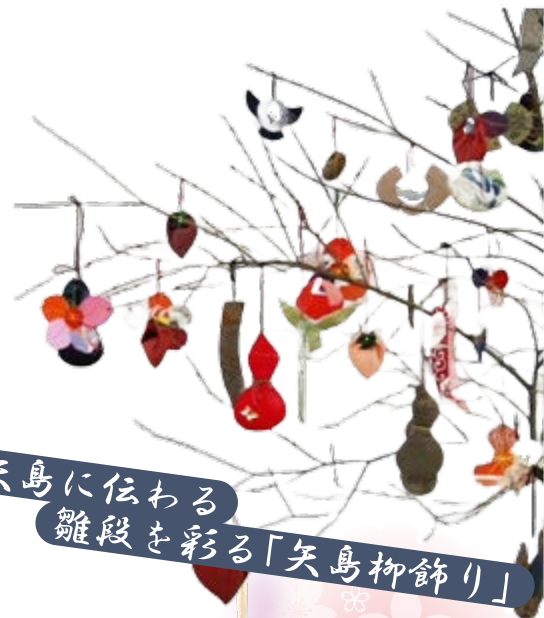
矢島に伝わる 雛段を彩る「矢島柳飾り」