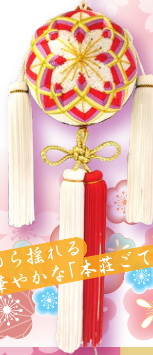
ゆらゆら揺れる 華やかな「本荘ごてんまり」