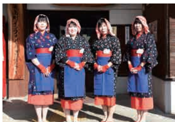
列車アテンダント