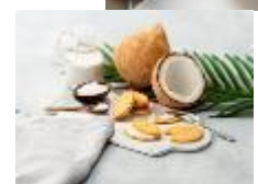
⑤【東京の人気おみやげ品】