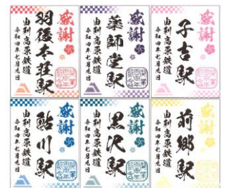
③【由利高原鉄道限定鉄印】