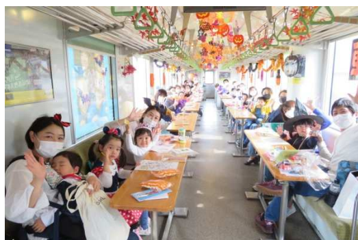
車内は仮装のお客様で大盛り上がり

10月19日〜31日の期間でハロウィン列車を運行しました。2002号車と矢島駅待合室をハロウィン仕様に飾り付けをしました。期間中は488名のお客様にご乗車していただき、写真撮影やプレゼントのキャンペーンにも喜んでいただきました。