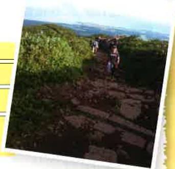
秋田駅・羽後本荘駅発 小人料金一律