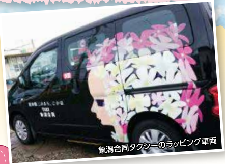
象潟合同タクシーのラッピング車両