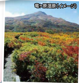
電ヶ原湿原(イメージ)