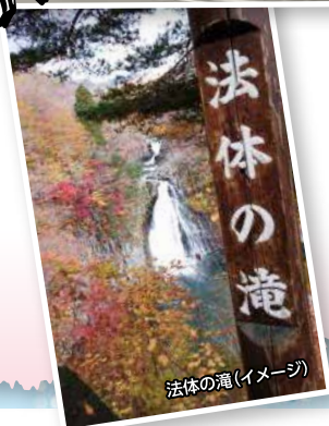
法体の滝(イメージ)

酒田駅 8:00発 = (にかほっと) = 矢島町の禅道場「国際禅堂」(見学) = = 民俗芸能伝承館「まいーれ」(見学) = 百宅そば「ももや」(昼食) = = 玉田溪谷から法体の滝へ散策(約70分) = (にかほっと(買物)) = 酒田駅 ※ガイド同行 16:30頃着