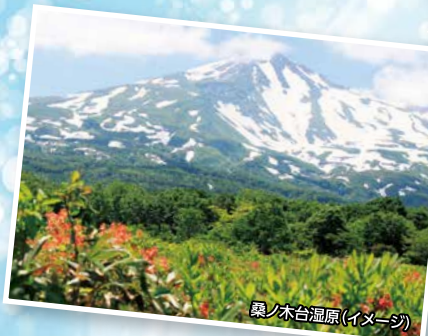
黒ノ木台温泉(イメージ)