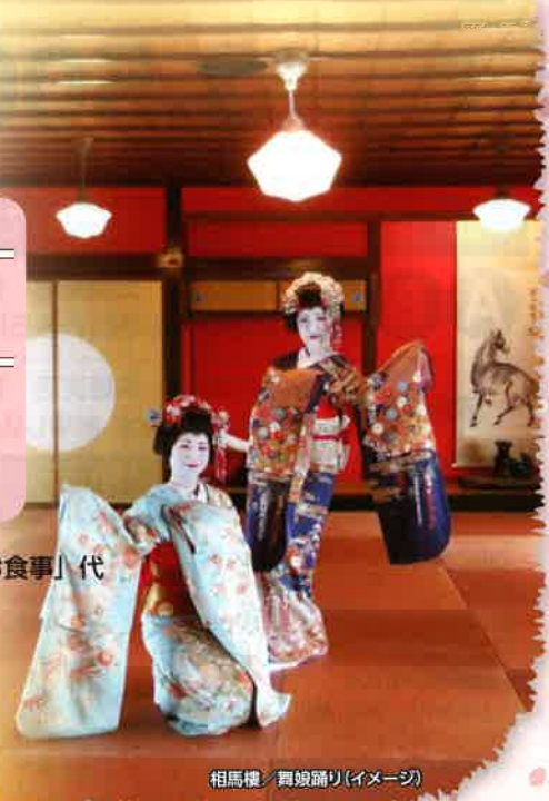
相馬樓・舞娘踊り(イメージ)

旅行代金 ツアー代金に含まれているもの バス代金・施設入場料・「舞娘踊りとお食事」代 秋田県庁・秋田駅発 羽後本荘駅発 大人・お一人 大人・お一人 13,800円 13,300円