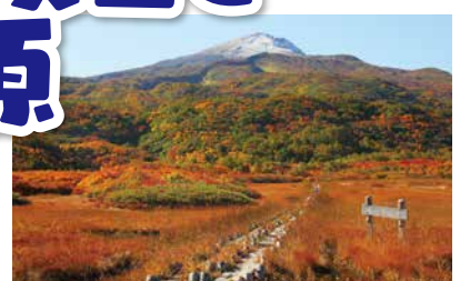
3 りゅうがはらしつげん ちょうかいざんやしまぐち 竜ヶ原湿原 (鳥海山矢島口)

鳥海山5合目の祓川ヒュッテのすぐ目の前に広がる湿原。目に鮮やかな赤・黄・緑のコントラストが織りなす奥行きのある紅葉が美しい