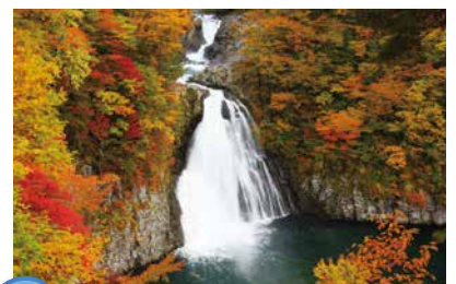
2 ほったい たき 法体の滝

明治から大正時代の校舎形式を引き継いだ、昭和29年(1954)建築の木造校舎。現存する木造校舎では、秋田県最大級の規模。現在は廃校となり、平成24年に国登録有形文化財に指定された