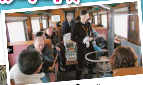
津軽鉄道 ストーブ列車(イメージ)

北国にとってはやっかいものの雪。しかし、雪があるからこそできることがある。夏の田んぼアートがとて有名な田舎館村だが平成28年から新たに冬を楽しむ為「スノーアート」なるものを始めるのだ。そう、平成28年が記念すべき第1回目! 見に行ってみようではないか!