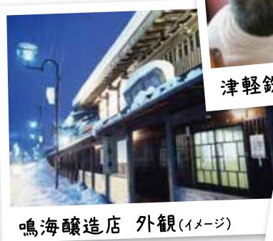
鳴海醸造店 外観(イメージ)