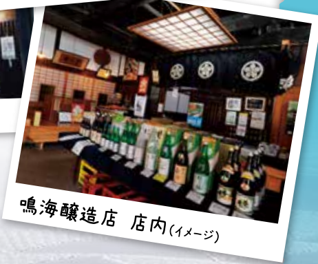
鳴海醸造店 店内(イメージ)

※鳥海山ろく線のご乗車は無料です。裏面のお申込み書にご乗車駅をご記入ください。 ※道路状況などによってルートを変更する場合があります。