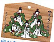
▲矢島ひなめぐり券 300円 【絵馬】になっています。

生駒家の旧城下町。20か所以上の商店や個人宅等で展示。主要展示会場を巡る【矢島ひなめぐり券】は矢島駅・福祉会館・道益苑・鳥海山麓地区総合案内所で販売。また同所では、矢島ひなめぐりガイドブックや矢島ひなめぐり限定グッズ、特産品なども販売しております。お土産にどうぞ!!