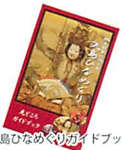
矢島ひなめぐりガイドブック

矢島地域のお雛様を写真入りで詳しく紹介しています。矢島駅・福祉会館・道益苑・鳥海山麓地区総合案内所で販売(300円)