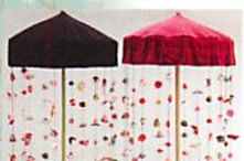
▲つるし雛(カダーレ)